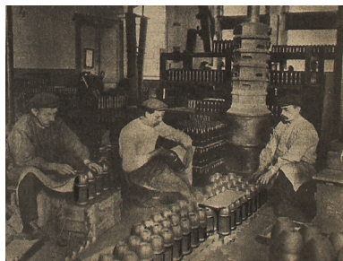
Iz tvornice municije za vojsku: granate se pune i zatvaraju (Ilustrovani list, 1915., br. 24, str. 570)

da je u Prvom svjetskom ratu posebno na cijeni bilo željezo, i sve vrste kovina koje su za ratne potrebe bili vredniji od zlata. Od željeza se, naime, izrađivalo toliko potrebno oružje i municija, da je upravo tijekom ratnih operacija ovisio o njihovoj opskrbi na bojištu. Tako se civilno stanovništvo pozivalo na akcije prikupljanja željeza, u kojima su se čak skidala i crkvena zvona.