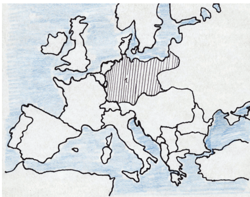
Svrstanost zemalja u Prvom svjetskom ratu

Neoznačene zemlje ostale su neutralne tijekom rata.