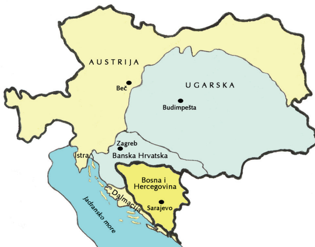
Karta s prikazom vojne, upravne i teritorijalne podjele hrvatskih zemalja u okviru Austro-Ugarske Monarhije