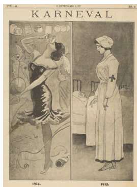
Ilustrovani list, 1915., br. 6, str. 144

Jedna od pozitivnih i dalekosežnih tekovina rata bila je emancipacija (osamostaljenje) žena. Ratne prilike odvojile su žene od njihove tradicionalne uloge majke i kućanice, te upravo one postaju glavna gospodarska snaga zaraćenih zemlja. Kako je velik broj muškaraca bio upućen na ratište, žene zauzimaju njihova ispražnjena radna mjesta. Zanimljivo je da do početka rata većina žena nije bila plaćena za rad niti su imale pravo glasa. Njihov novi položaj u društvu posebno je vidljiv u modi. Žene počinju šišati kosu i nositi kratke suknje.