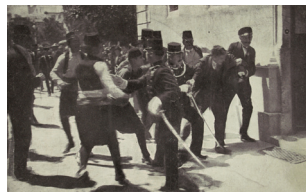
Trenutak uhićenja atentatora Gavrila Principa, Sarajevo, 28. lipnja 1914.

uzrok – povod – posljedica: ono što izaziva neku pojavu - ono što potiče – ono što proizlazi iz uzroka