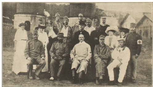
Skrb za ranjenike u Rijeci, (Ilustrovani list, 1915., br. 7, str. 148)

Bolnice, lječilišta i oporavilišta u gotovo svim hrvatskim gradovima postaju prihvatilištima stalno nadolazećih ranjenih vojnika s bojišta. Sanitetske službe za ranjene vojnike bile su organizirane i u školama, kinima, tvornicama i drugim gradskim ustanovama. Vodeću ulogu u organizaciji zbrinjavanja ranjenika imao je Crveni križ. Njegova uloga je uz državne organe (Biro za ratnu