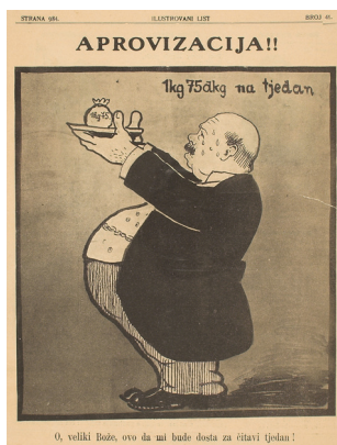
Ilustrovani list, 1915., br.41, str. 984

Opskrba hranom i proizvodima uslijed oskudice i gladi u vrijeme rata postala je od državne važnosti. U Beču je u tu svrhu bio osnovan Ratni žitni zavod te je u cijeloj Monarhiji 1915. proveden popis stanovništva kako bi se evidentirao broj mogućih korisnika kruha. Hrvatski sabor (u banskoj Hrvatskoj) koji se tijekom rata sazivao, također je vodio brigu o opskrbi pučanstva hranom. Posebne komisije provodile su rekviziciju uroda i stoke te propisivale i kontrolirale njihovu preraspodjelu u pojedina područja i gradove. Nestašica namirnicama posebno je pogodila Dalmaciju i Istru u čijim su gradovima uvedene krušne karte, dok se u sjeverozapadnoj Hrvatskoj u nedostatku žita pravio kruh od groždanog tropa. Svemu tome