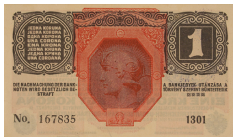
Novčanica od jedne krune, Austro-Ugarska Banka, tiskano u Beču, 1916.

(Vjesnik županije virovitičke, 1916., br. 12, str. 125)