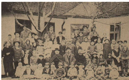
Bosansko-hercegovačka djeca u Donjem Miholjcu (Ilustrovani list, 1918., br.10, str. 149)