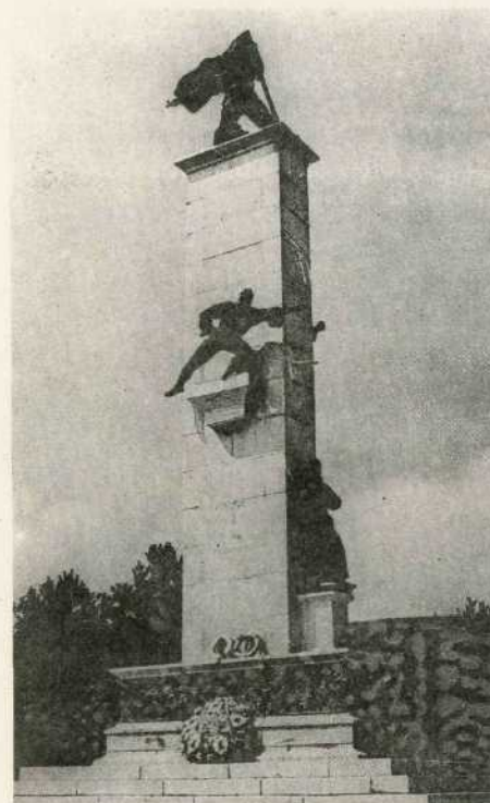
Spomenik »Ustanak« u Srbu

prijetila od vanjskih neprijatelja, baš zbog toga što su unutarnji neprijatelji u licu buržoaske vladajuće klase činili sve ono što je vodilo zemlju u propast. Mi smo godinama zvali na skup sve što je pošteno i rodno ljubivo radi borbe, u prvom redu protiv tih unutarnjih neprijatelja, koji su kroz dvadeset godina krčili put imperijalističkim razbojnicima koji su danas porobili i narode naše zemlje. Svi režimi od reda zbog toga su nas krvavo proganjali. Režim Cvetković-Maček dao je po ulicama Beograda, Splita, Zagreba itd. strijeljati u masu zbog toga što je narod pod vođstvom Komunističke partije tražio da se preduzmu sve mjere u interesu odbrane nezavisnosti naroda Jugoslavije. Zbog toga su bili stvoreni koncentracijski logori za komuniste i ostale borce radničke klase. Zbog toga su bili hapšeni i predani stotine i hiljade najboljih boraca, sinova našeg naroda.