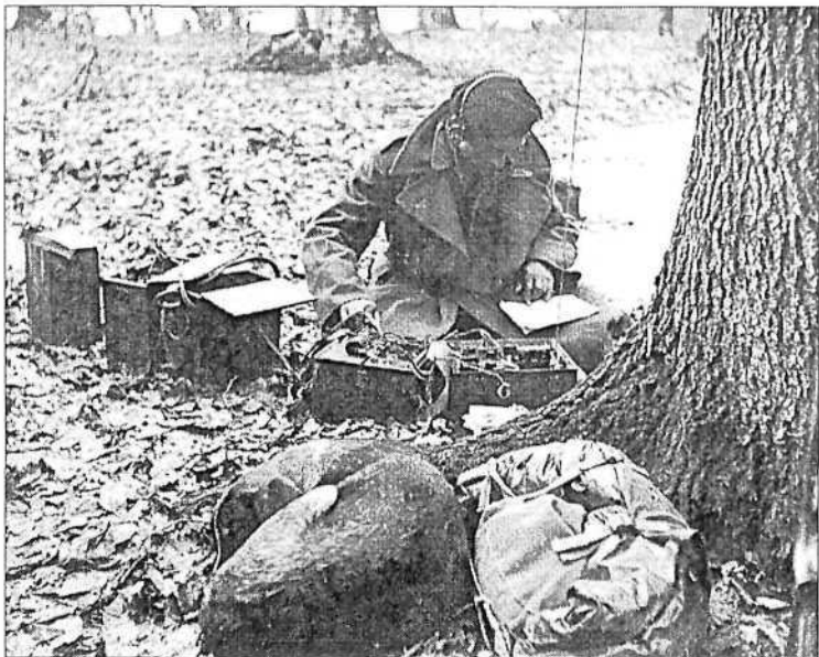
Psunj, 1944. Telegrafist autor: nepoznat HPM, Zbirka fotografija, filmova i negativa, inv. br. 2201-232

okupiranoj Evropi koji je označio vrhunac kulturno-umjetničke i promičbene djelatnosti hrvatskoga antifašističkog pokreta.