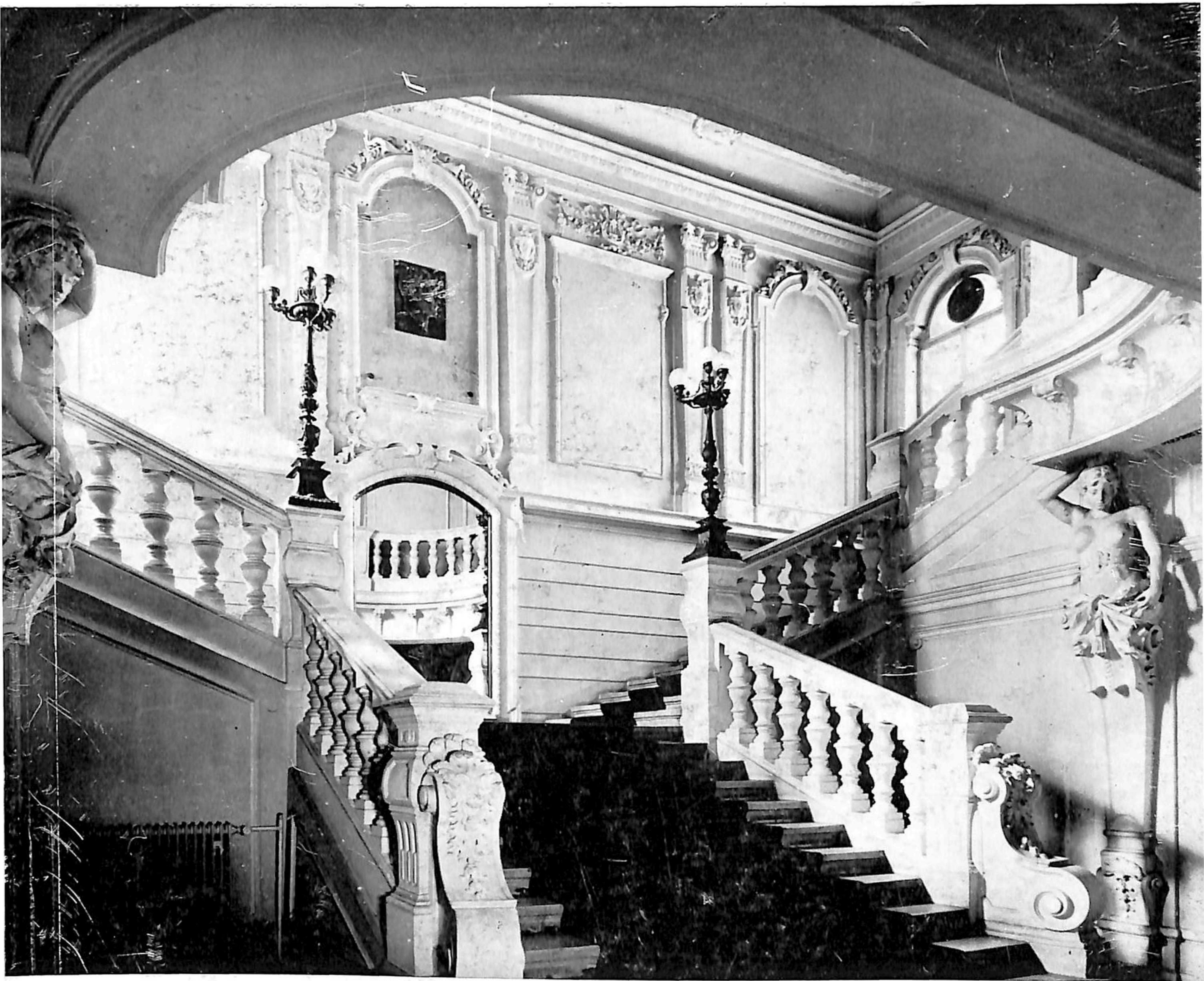
150 GODINA HRVATSKOG GLAZBENOG ZAVODA